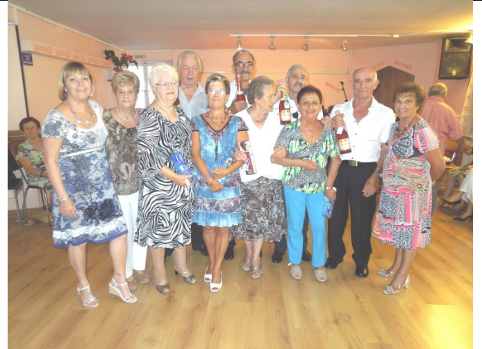
LES NATIFS D'AOUT