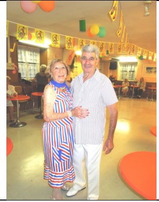
Les adhérents ont assorti leur tenue au thème du jour