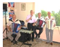
L'accordéon est le roi chez nous