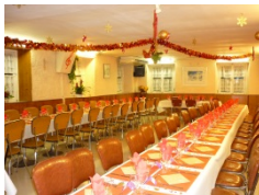
Le Réveillon du jour de l'An