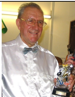
4000 ème thé dansant