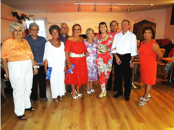
LES GYMNASTES SONT EN FORME