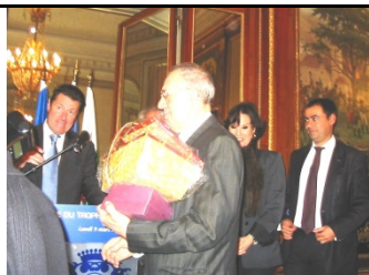
Trophée de la Ville De Nice

Il ne recherchait pas les honneurs il était modeste et il a fallu « le pousser » pour recevoir ces récompenses