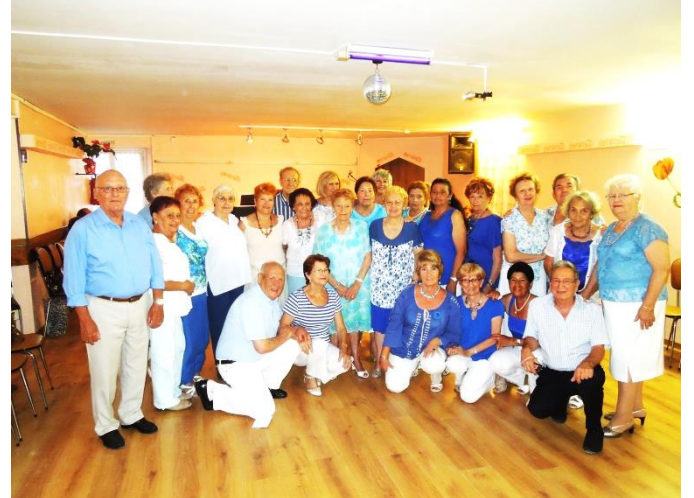
JOURNEE EN BLEU ET BLANC