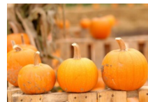
journee en Orange : faites le plein de vitamines