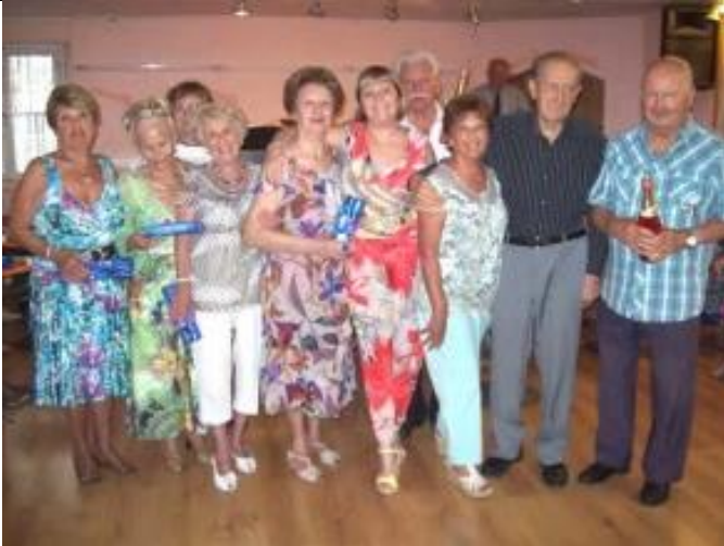
LES NATIFS DE JUILLET et SEPTEMBRE